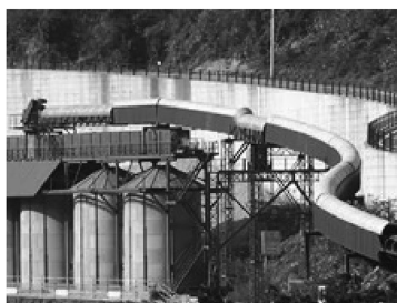
土砂搬送用コンベアシステム

高周波応用部門では、高周波誘導加熱装置の開発・製作・販売、高周波熱処理受託加工、真空熱処理炉の製作・販売を行っている。