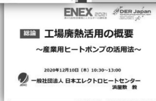
工場廃熱活用セミナーの予稿集及び会場の様子