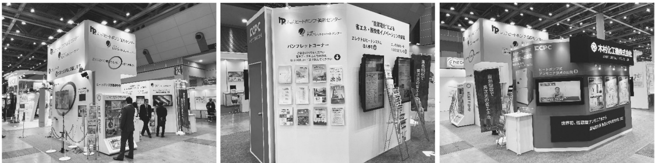
ENEX 会場内出展ブース（12/10 開場前の様子）