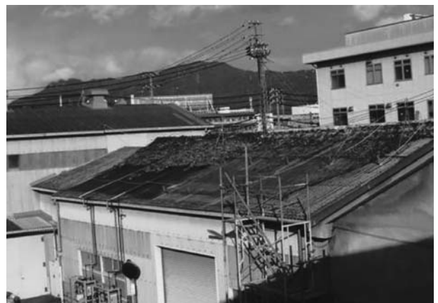
写真1 工場屋根への設置状況

実証規模での屋根面緑化システムによる適応性の確認試験を行った結果、夏季の葉焼けや冬季の変色は見られたが、枯死などのトラブルは発生しなかった。こ