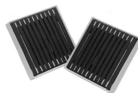
写真 1 QUT50

今回は、その中から印刷・塗装乾燥工程への設備導入事例および特徴・効果について紹介する。